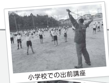
小学校での出前講座

また、なわとびの全国統一検定の導入・普及を進めるほか、全国なわとびスピードコンテストに障害者も参加できるようにする等、より多くの方々がなわとびに親しみ、心身の健康維持を図れるよう事業を進めています。