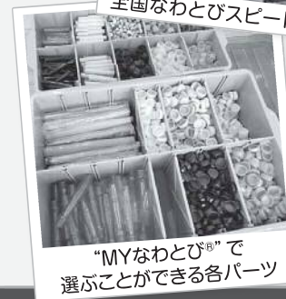
“MYなわとび®”で 選ぶことができる各パーツ