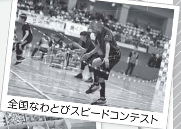
全国なわとびスピードコンテスト