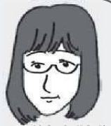
イラスト協力: 加藤舞美

2020年、オリンピックイヤーの始まりですね! 観戦チケットの申し込みに乗り遅れ、テレビ観戦を決め込んでいますが、いよいよ近づいてきたぞという実感でワクワク度もアップ! 注目はやっぱり体操ニッポンです。今年も皆さんの市民活動が充実したのになりますように、応援できればと思っています★